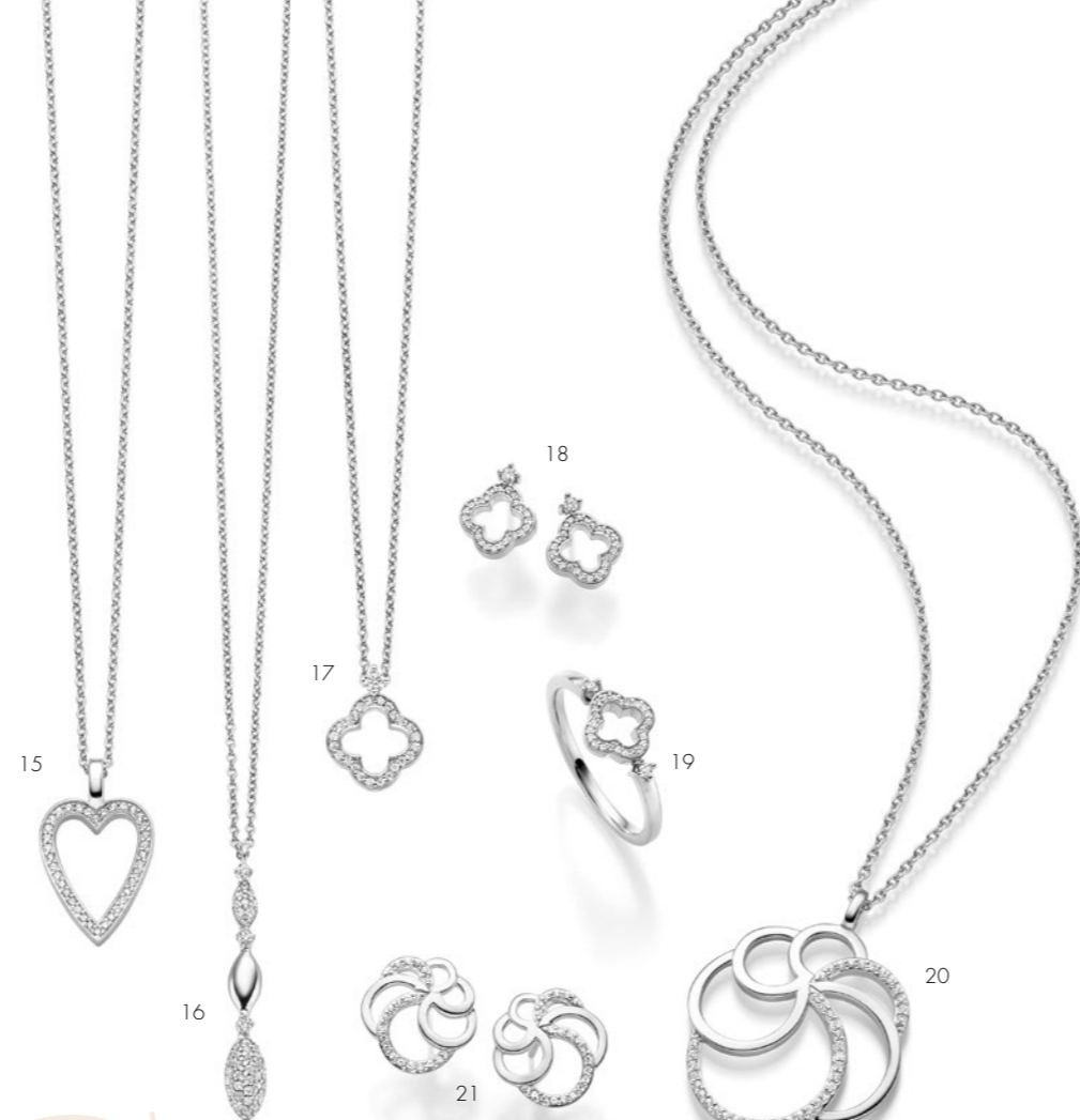
15. Collier | Necklace € 149 • 16. Collier | Necklace € 179 • 17. Collier | Necklace € 139 • 18. Ohrschmuck | Earrings € 139 • 19. Ring € 129 20. Collier | Necklace € 229 • 21. Ohrschmuck | Earrings € 169 • 22. Ohrschmuck | Earrings € 129 • 23. Ring € 119