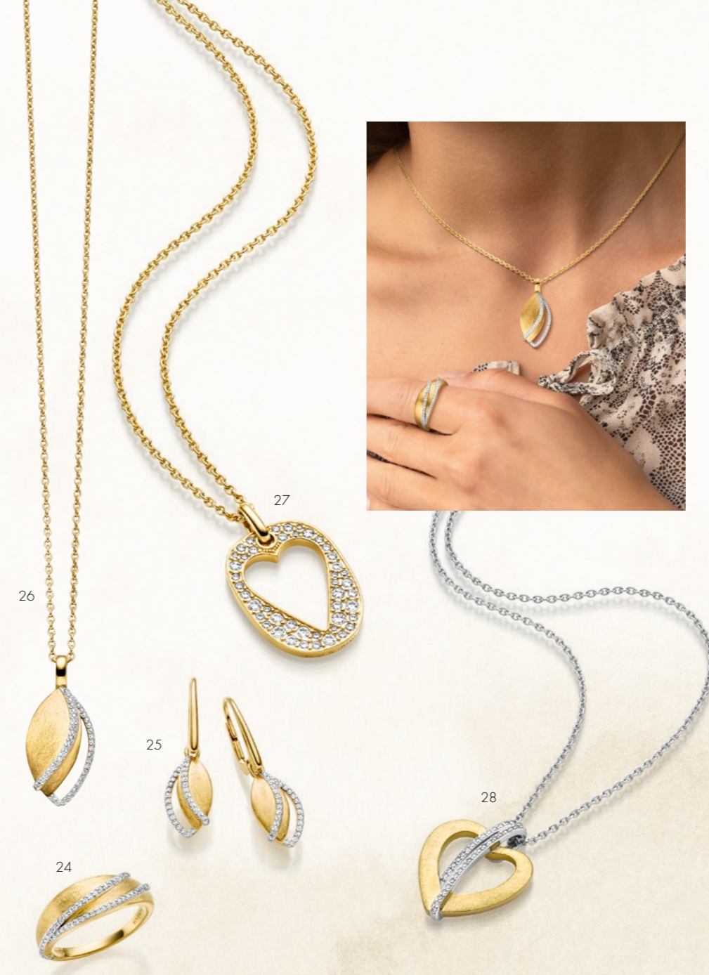
24. Ring € 249 • 25. Ohrschmuck | Earrings € 259 • 26. Collier | Necklace € 259 27. Collier | Necklace € 259 • 28. Collier | Necklace € 269