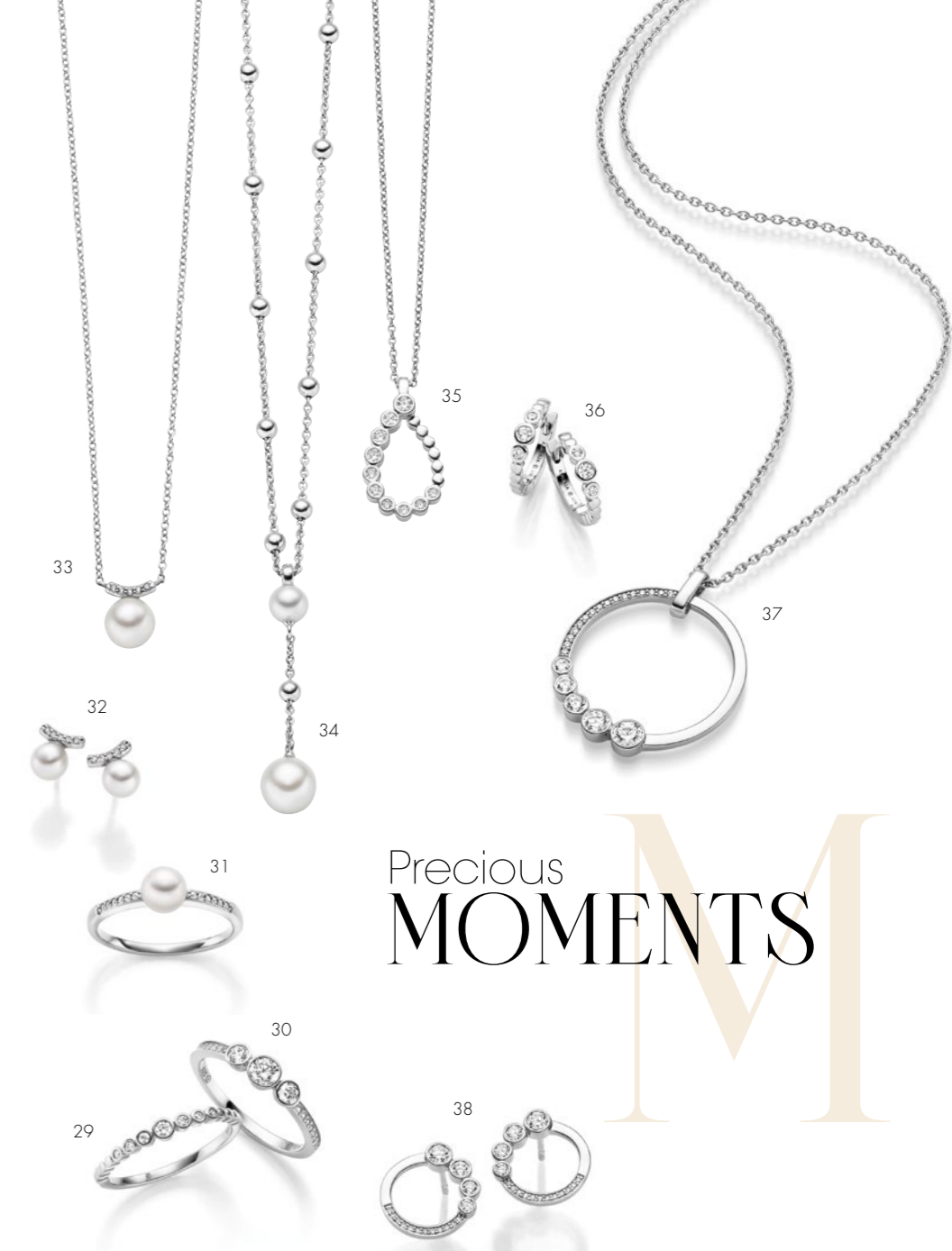
29. Ring € 119 • 30. Ring € 129 • 31. Ring 1 € 149 • 32. Ohrschmuck | Earrings 1 € 139 • 33. Collier | Necklace 1 € 169 • 34. Collier | Necklace 1 € 229 35. Collier | Necklace € 149 • 36. Ohrschmuck | Earrings € 139 • 37. Collier | Necklace € 189 • 38. Ohrschmuck | Earrings € 149