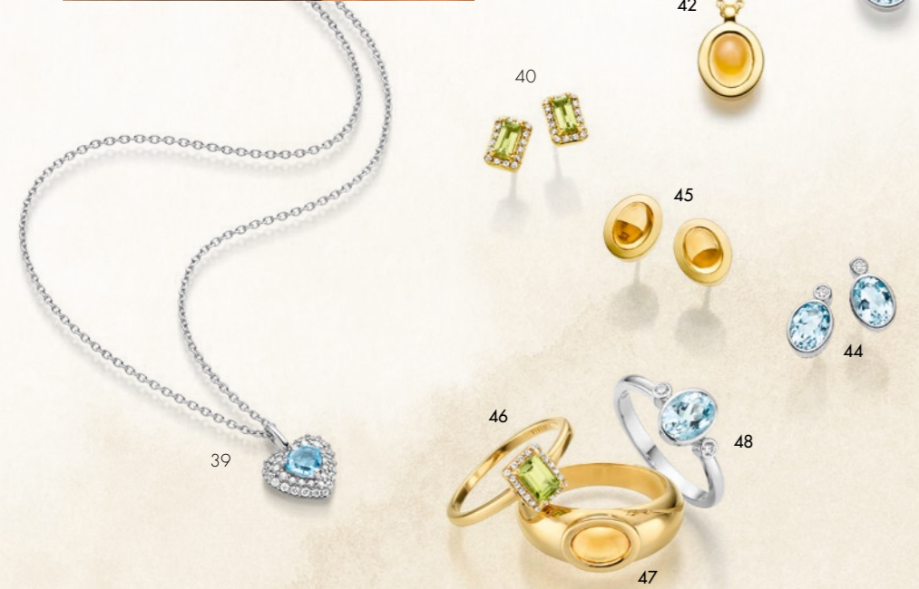
Model: Ring € 219 • Collier | Necklace € 239 • Ohrschmuck | Earrings € 219 39. Collier | Necklace 1 € 199 • 40. Ohrschmuck | Earrings 2 € 179 • 41. Collier | Necklace 3 € 219 • 42. Collier | Necklace 2 € 199 43. Collier | Necklace 1 € 219 • 44. Ohrschmuck | Earrings 1 € 179 • 45. Ohrschmuck | Earrings 2 € 219 • 46. Ring 1 € 179 • 47. Ring 2 € 259 • 48. Ring 1 € 169 1 Blautopas beh. | 1 blue topaz treated • 2 Citrin | citrine • 3 Peridot