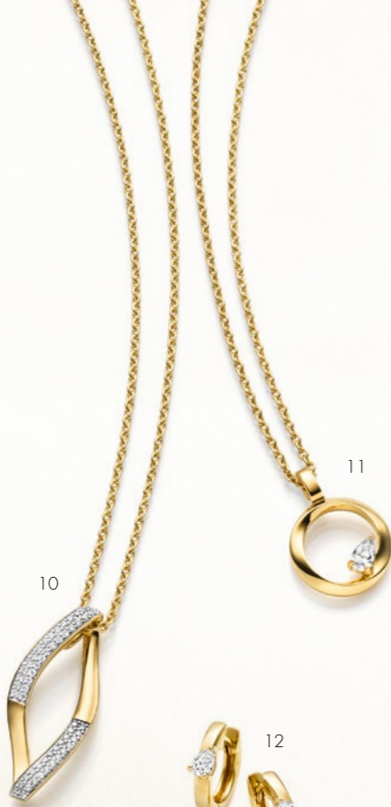
7. Ring € 199 • 8. Collier | Necklace € 219 • 9. Ohrschmuck | Earrings € 169 • 10. Collier | Necklace € 249 11. Collier | Necklace € 199 • 12. Ohrschmuck | Earrings € 159 • 13. Ring € 139 • 14. Ring € 219