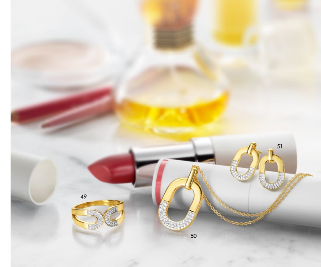
49. Ring € 219 • 50. Collier | Necklace € 239 • 51. Ohrschmuck | Earrings € 219

Herausgeber | Publisher: Bruna Mayer GmbH & Co. KG Konzeption und Realisation | Conception and realization: ADDICTED CREATIVE SERVICES GMBH Schmuckfotografie | jewelry photograph: Studio Miko GmbH Alle Schmuckstücke in Silber 925/- mit Rhodiumauflage oder Gelbgold plattiert | All articles in Silver 925/- coated with rhodium or plated with yellow gold Steine: Zirkonia | Stones: cubic zirconia Anhänger mit Kette ca. 45 cm | Pendant with chain app. 45 cm Schmuckstücke leicht vergrößert | Jewellery slightly enlarged Für eventuelle Druckfehler und Farbabweichungen übernehmen wir keine Haftung | We do not take liability for any printing errors or colour variations Preisänderungen vorbehalten. Stand Januar 2026 | All prices are subject to change. Printed January 2026